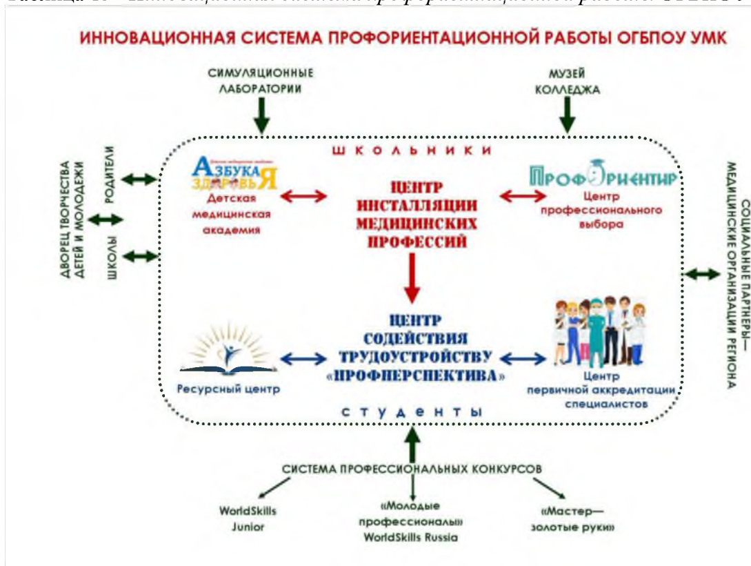
Таблица 15 - Инновационная система профориентационной работы ОГБПОУ УМК

В соответствии с планом работы Совета директоров средних медицинских и фармацевтических образовательных организаций Приволжского федерального округа 28 февраля 2019 года педагогическим коллективом Колледжа был организован и проведен Межрегиональный заочный фестиваль «Моя профессия – взгляд в будущее». Работа Фестиваля была организована по 3 направлениям :